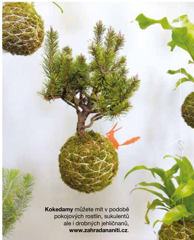
Kokedamy můžete mít v podobě pokojových rostlin, sukulentů ale i drobných jehličnanů, www.zahradanani.cz .

K závěsům, ať již klasicky nebo hlavou dolů, se dá použít ledacos. Kromě výše zmíněných květin si můžete aerárium osazovat třeba podle ročních období, od prvních jarních kvítků až po vánoční dekorace. Je už čistě jen na vás, co zvolíte. ■